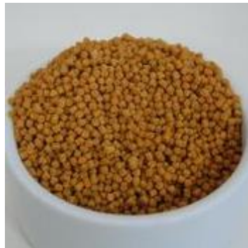
Nutropica Natural 300gr