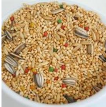
(Calopsitas e periquitos) 800gr

No Segundo Pote de porcelana (deixar direto na gaiola e trocar a cada 4 dias, caso caia sujeira, trocar toda a ração e lavar o pote de porcelana)