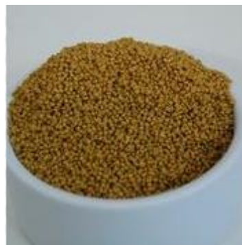
Megazoo PM13 300gr